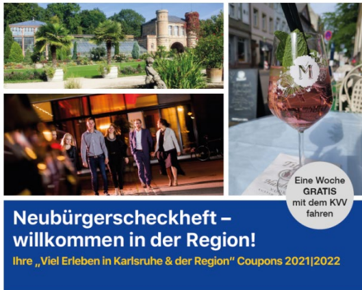
Ausgabe Neubürgerscheckheft 2021/2022

Das Neubürgerscheckheft für Karlsruhe und die Region geht dieses Jahr in die fünfte Auflage. Die vergangenen Jahre haben gezeigt, dass das Scheckheft nicht nur bei den Neubürgern gut ankommt, sondern auch den Geschäftsinhabern viele Vorteile bietet: