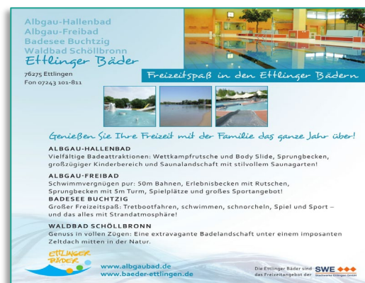
Beispiel für eine Werbeanzeige