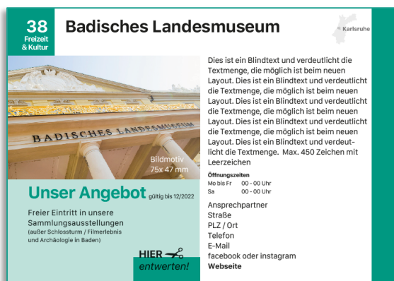
Beispiel für eine Angebotsseite